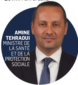
AMINE TEHRAOUI MINISTRE DE LA SANTÉ ET DE LA PROTECTION SOCIALE

L e Maroc a engagé une réforme sanitaire d'ampleur inédite, inscrite dans la vision de Sa Majesté le Roi Mohammed VI, visant à faire de la santé un pilier du développement, de la cohésion sociale et de la souveraineté nationale. La généralisation de l'Assurance Maladie Obligatoire (AMO) constitue le premier jalon de cette transformation. En quelques années, la couverture est passée de 42 % à 88 % de la population, soit plus de 32 millions de bénéficiaires, consacrant l'accès aux soins comme un droit fondamental et un levier de réduction des inégalités sociales et territoriales.