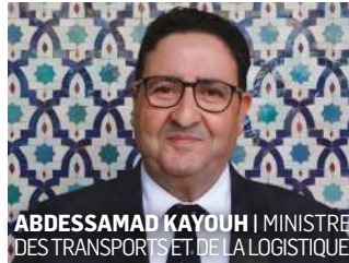
ABDESSAMAD KAYOUH | MINISTRE DES TRANSPORTS ET DE LA LOGISTIQUE

Parallèlement, le déploiement de 750 hectares de zones logistiques, y compris la