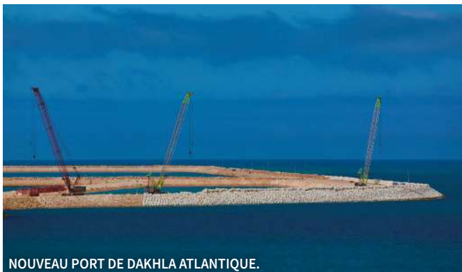
NOUVEAU PORT DE DAKHLA ATLANTIQUE.

Pour Roger Sahyoun, l'entreprise demeure avant tout un instrument au service d'une vision. ■