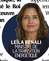
LEÏLA BENALI MINISTRE DE LA TRANSITION ÉNERGÉTIQUE

« Miser sur la transition marocaine, c'est s'engager aux côtés d'un pays qui croit en l'avenir », conclut Leïla Benali. ■