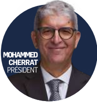
MOHAMMED CHERRAT PRÉSIDENT