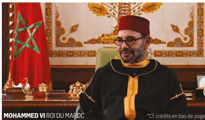
MOHAMMED VI ROI DU MAROC

Cette mutation se lit à travers les grandes villes du pays. Casablanca consolide son statut de hub économique tourné vers l'Afrique, Tanger s'impose comme un carrefour industriel et logistique majeur, tandis que Marrakech incarne le rayonnement touristique, moderne et cosmopolite du Royaume. Rabat renforce son rôle institutionnel et les provinces du Sud s'inscrivent dans une dynamique de dévelop-