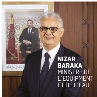
NIZAR BARAKA MINISTRE DE L'ÉQUIPEMENT ET DE L'EAU

Symbole de cette ambition, le port Nador West Med, opérationnel cette année, relie une zone industrielle de 5 000 hectares. Premier port gazier du pays et plateforme stratégique pour l'exportation d'hydrogène vert, il s'inscrit dans une dynamique logistique. À Dakhla Atlantique, un port en eaux profondes ouvrira l'Atlantique aux pays du Sahel et soutiendra l'industrie et les énergies vertes. Ces hubs s'intègrent